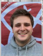
Corin Vorstand Stammtisch