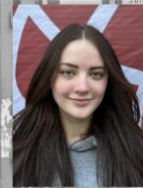
Philomena Büro Veranstaltungen