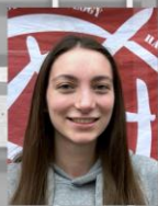
Solène OE-Woche Prüfungsp. Webmaster