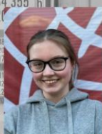
Lissi StuPa BA-Ansprech. Veranstaltungen