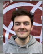
Julian Prüfungs-A. OE-Woche Material