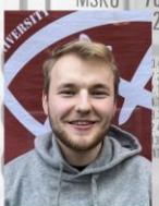
Jakob Finanzen OE-Woche BA-Ansprech.