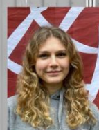
Mara Material Stammtisch