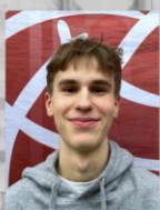
Linus Finanzen StuPa Stammtisch