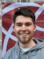
Lorenz Vorstand Widerspruchs-A. Firmenkontakte Mails